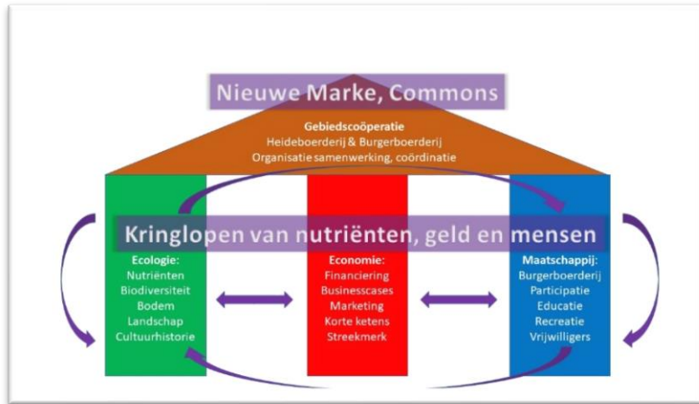
Figuur 2: De principes van de heideboerderij.

Voor het in de praktijk brengen van de heideboerderij is het nodig om ecologische, economische en maatschappelijke kringlopen te optimaliseren en op elkaar af te stemmen, en daarnaast de vernieuwing vormgeven naar het voorbeeld van de Marke of Gemeynt met als doel een gezamenlijk beheer van gemeenschappelijke natuurlijke hulpbronnen als landschap, bodem, biodiversiteit en water. Het past bij de geschiedenis en de filosofie van de heideboerderij om die bottom up op te pakken, waarbij vanuit de filosofie van de heideboerderij aansluiting gezocht wordt bij lokale initiatieven (Figuur 3). Die initiatieven en de partijen die daarbij betrokken zijn, verschillen per locatie.